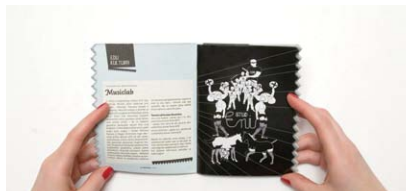
BEKET, Budor+Čule za štud teatar