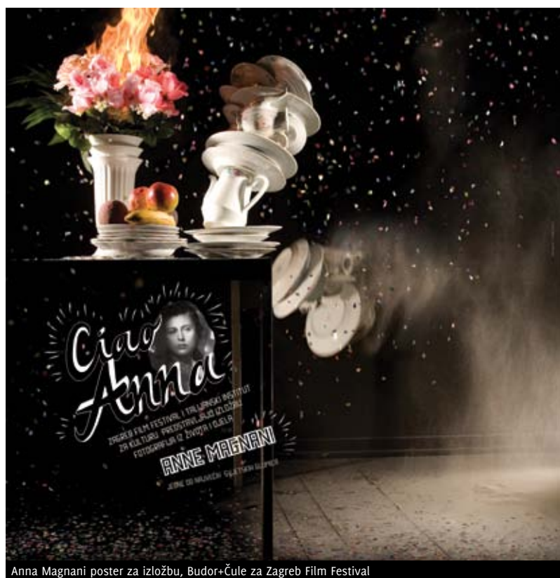
Anna Magnani poster za izložbu, Budor+Čule za Zagreb Film Festival